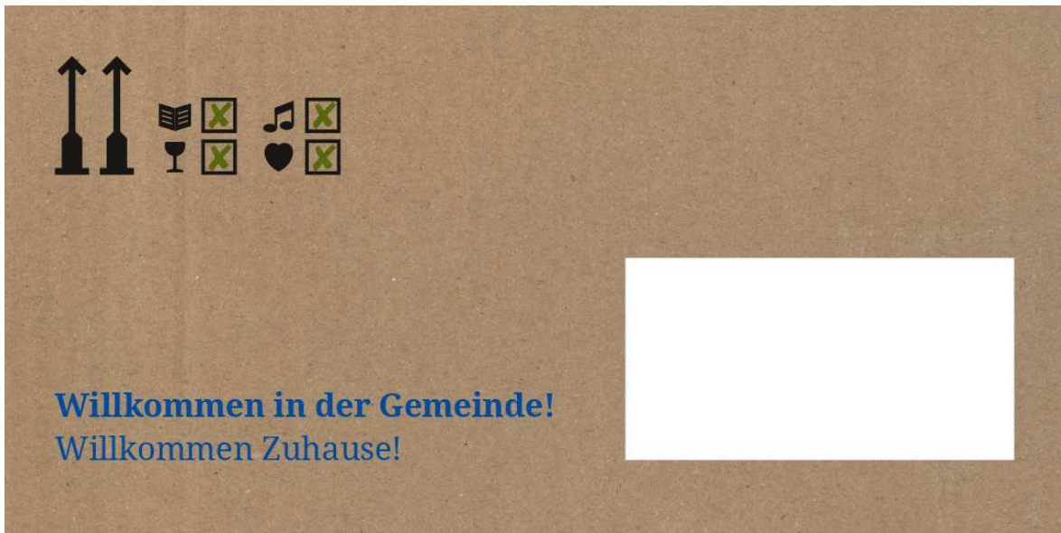
Ansicht Briefvorlage außen